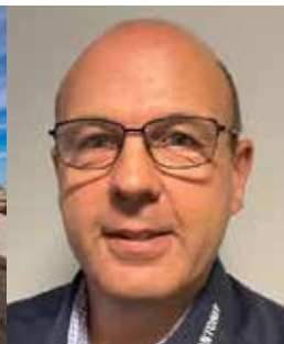
Area Sales Manager