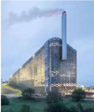
Bæredygtig kraftvarme- produktion