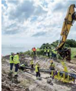
Varmaefledning af højspændingskabler