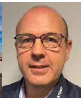
Area Sales Manager